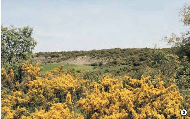
Paisaje de campos de aliagas

por la N-120 (Burgos-Logroño), carretera desde la cual tomar la BU-8001 a Castrillo del Val, punto de partida del sendero. El panel de inicio de ruta está junto al ayuntamiento.