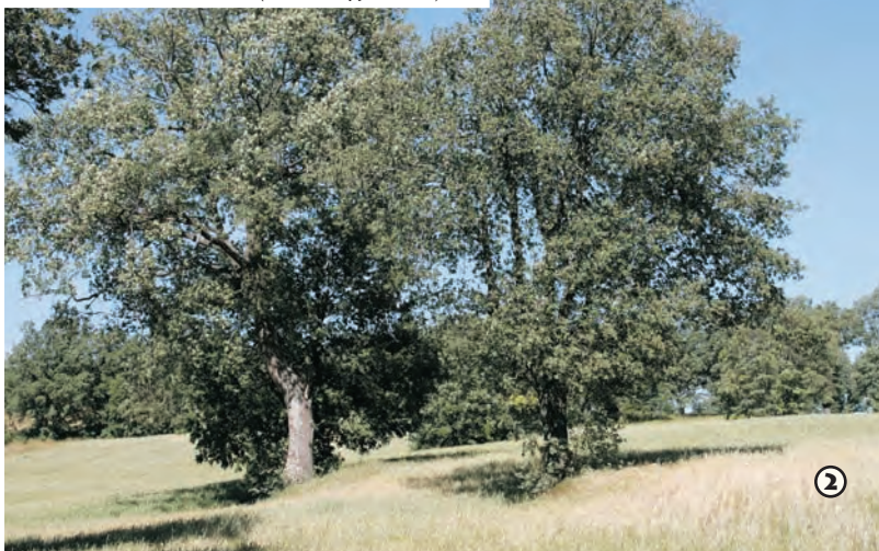
Roble rebollo ( Quercus pyrenaica )

1 El famoso caballero don Rodrigo Díaz de Vivar, El Cid Campeador, compró a la abadía de Covarrubias parte o todo el dominio de Madrigal del Monte. Cuando contrajo matrimonio con doña Jimena le entregó una fuerte dote de propiedades, entre las que se encontraba Madrigal. La mención se halla en la Carta de Arras situada en la Catedral de Burgos. Así, la villa quedó unida para siempre al héroe castellano.