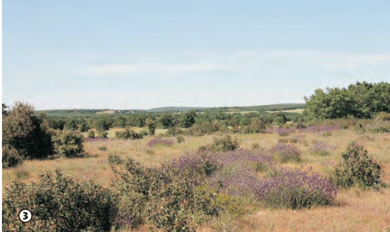
La jara o estepa negral, acompaña de cantueso

Cartografía 1/25.000 IGN Hojas: 276 - II