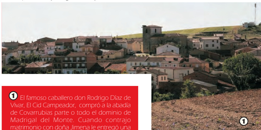
Madrigal del Monte

1 El famoso caballero don Rodrigo Díaz de Vivar, El Cid Campeador, compró a la abadía de Covarrubias parte o todo el dominio de Madrigal del Monte. Cuando contrajo matrimonio con doña Jimena le entregó una fuerte dote de propiedades, entre las que se encontraba Madrigal. La mención se halla en la Carta de Arras situada en la Catedral de Burgos. Así, la villa quedó unida para siempre al héroe castellano.