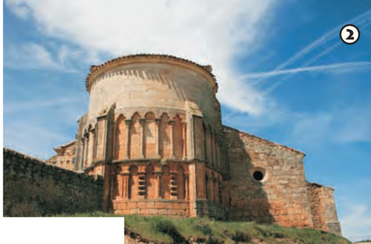
Iglesia románica s. XII - XIII

2 La iglesia de San Pedro, situada en Castrillo Solarana, está considerada como una de las más singulares del románico burgalés. Fechada a finales de s.XII o principios de s.XIII sobresale por su ábside semicircular compuesto por una doble arquería ciega constituida por arcos apuntados en el cuerpo inferior y trilobulados en el superior.