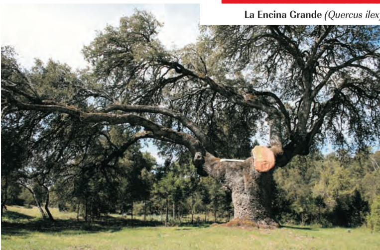
Dehesa de encinas